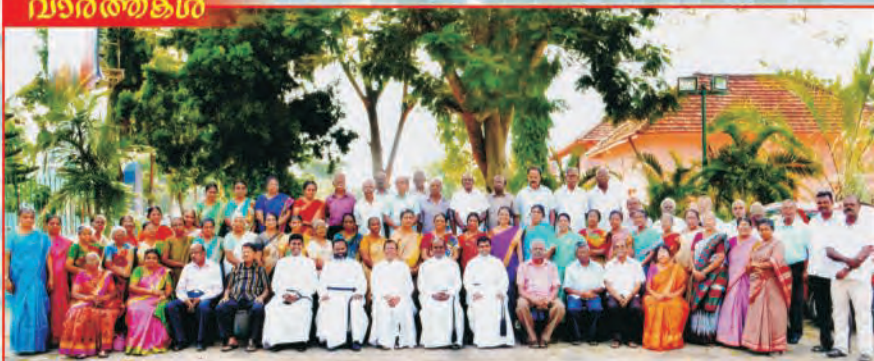
CSI M.M.CHURCH SENIOR CITIZENS' DAY CELEBRATIONS ON 24 TH SEPTEMBER 2017