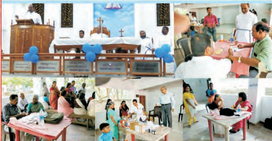
Gospel Band Convention Meeting & Medical Camp at Planghotumughal, Malayam Dist.