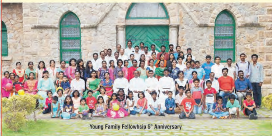
Young Family Fellowship 5 th Anniversary