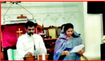
Candle light Celebration of Women's Fellowship-2020