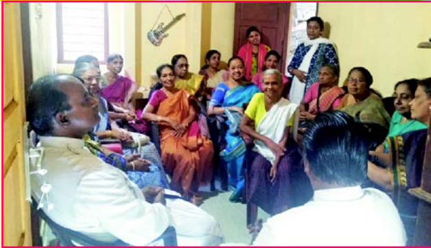
House Dedication (Women's Fellowship Project 2019)