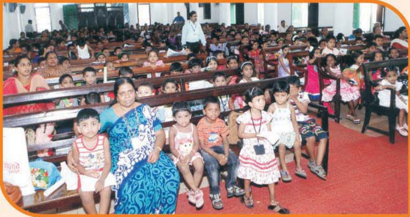
M.M. Church V.B.S. 2013