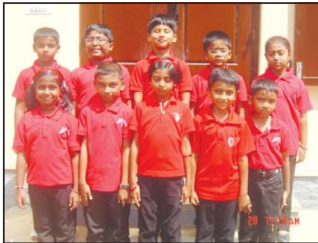
Group Song - III rd