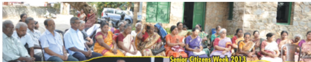
Senior Citizens Week 2013