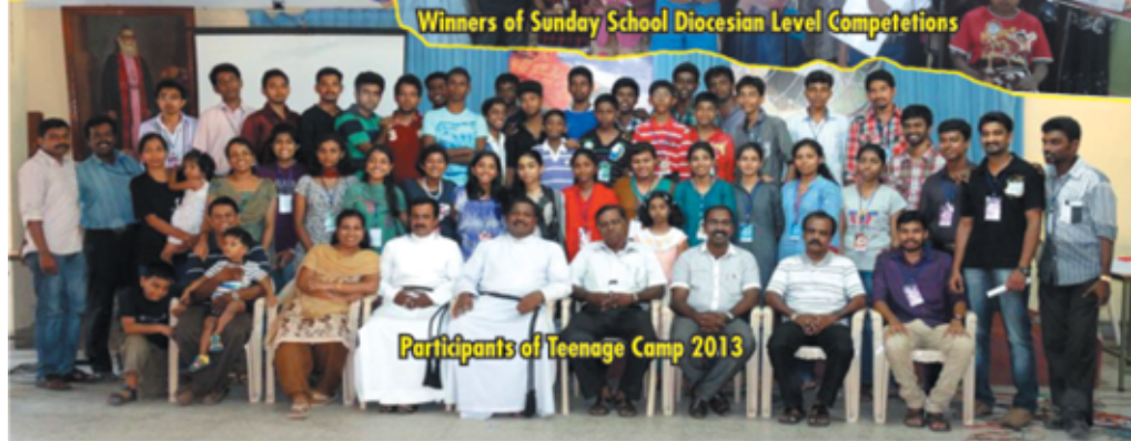
Participants of Teenage Camp 2013