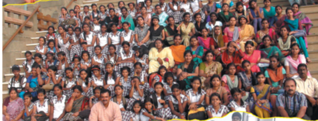
Sunday School Retreat at Kanyakumari