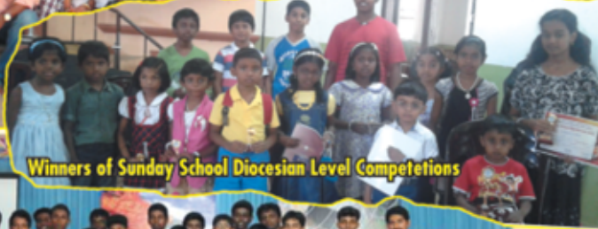
Winners of Sunday School Diocesan Level Competitions