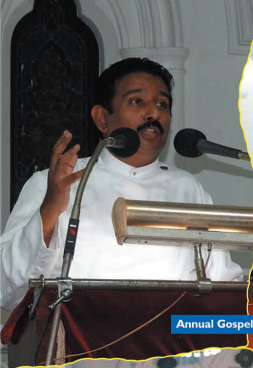
Annual Gospel Convention 2013