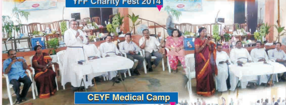
CEYF Medical Camp