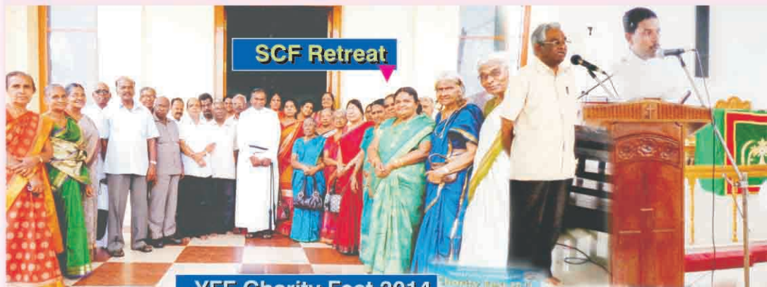
YFF Charity Fest 2014