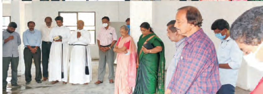
Dedication of Church Office Annexe